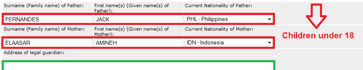
3-2: Parents or legal guardian